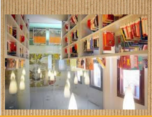
Bizenta Mogel Liburutegia