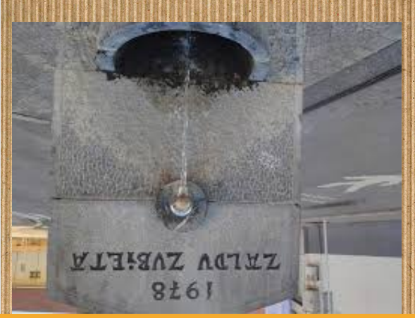
Zaldu zubietara iturria

Zaldu Zubietara iturria, Zaldibarren dagoen iturri bat da. Bere goialdean " 1978 Zaldu Zubietara " jartzen du. Zaldu Zubietara iturriko goialdean 1978 jartzen du urte horretan egln zelako. A