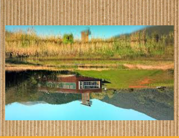
Urdabai Bird Center

Urdabai Bird Center publikoarentzat irekia dagoen naturaren museo bitxia da, bertan hegaztien eta hauen migrazioen ezaguera lantzen da, hauen behaketa barne. Urdabai Bird Center-en instalazioa Urdabaiako paduren hegaztientzako behatoki bat da.