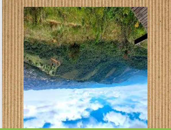
Pico do Imbirí

Pico do Imbirí 1862 metro neuritzen ditu, Campos do Jordaoiko punturik altuena da. Goitik bista oso politak daude; bertara igotzeko ibilbidea oso erraza da, familiar erraz igotzeko da, bertan turista asko ibiltzen da. Bertako basoaren berde bizia inguratuta eta muturreko berdexkek zeharkatuta, Imbirí ekoturismoa eta bizikleta, zaldi, moto eta quad ibilaldiak egiteko ere gomendatzen da.