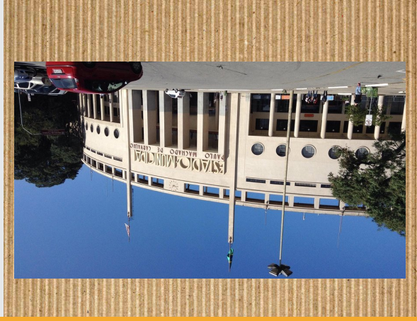
Museu do Futebol

Futbol museo (Museo do Futebol)A futbolari dedikatutakoA museo tematikoa da.