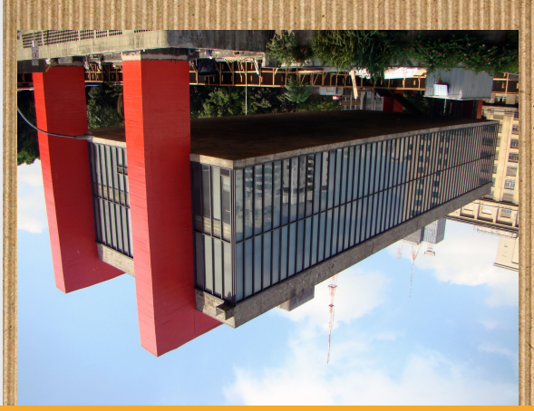
Lina Bo Bardi