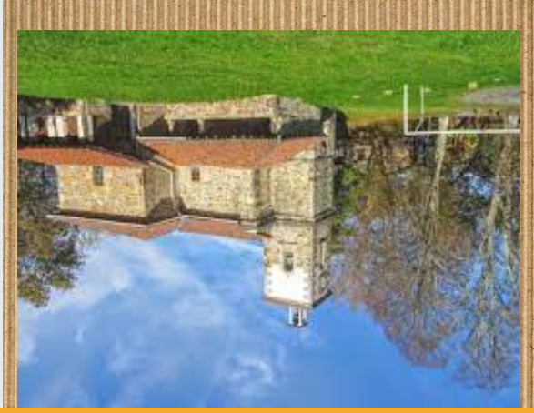
SAN ANTONIO ERMITA