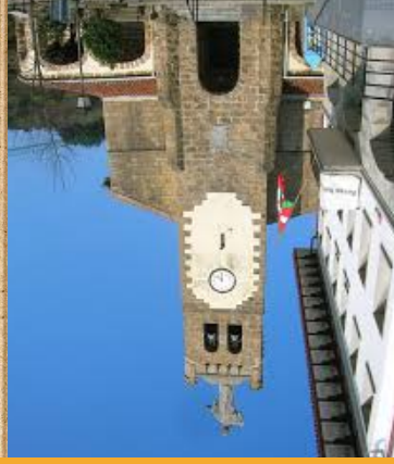
San Andres Eliza