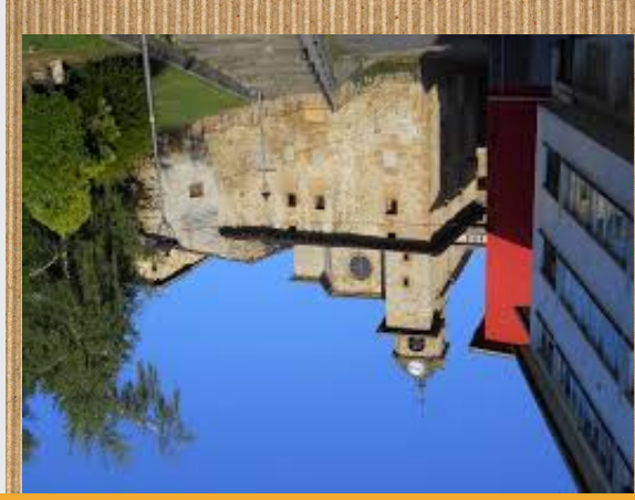
SAN ANDRES ELIZA

San andres eliza, eliza bat da eta jendea ototz egite dute elizan. Elizan kontzertuak egiten dira.