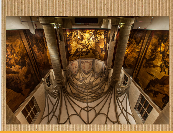
San Telmo museo

San Telmo Donostian dago, alde zaharrean dago. 1902an egituratzen hasi zen. 1932an ireki zuten lehengo aldiriz museo bezela. San Telmo museoaren estiloa gotikoa eta errenazimentua da. San Telmo museoak bi solairu nagusi ditu. Behan milaka eta milaka historia dago. 1. solairuan azken 200 urtez kontatzen diren historia eta 2. solairuan arte ederrena da.