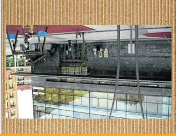
Torrezabal kultur etxea

Torrezabal kultur etxea J. Vidaurrazabal Zugaztik egln zuen. Egun batean, Torrezabal kultur etxean 399 pertsona sartu ziren eta hori asko da. Torrezabal kultur etxea Lehendakari Agirre Plaza dago, eta eraikin polit honen barnean Zinema bat, bitxi, buru handi, begi beltz, eta moko gakoak adar zentzuzkoak da. Eskultura honetan mozoi dago, autore ez dakigu. Zabalera auzoan kokatuta dago. Moziloaren parkean Mozoiola