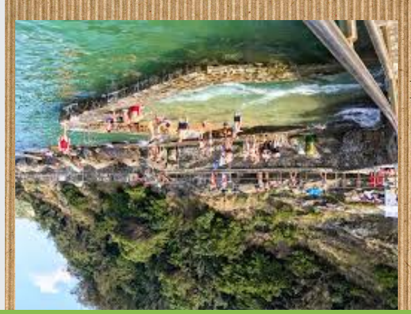
SANTA KLARA UHARTEA

Irlara joateko itsasontziak daude Alde Zaharreko kaitik aterzen direnak. Irlaren goikaldean itsasargi bat dago. Irlan kala txiki txikiak daude uretan sartzen baina bazara arrain asko ikusiko dituzu. Hor bazkaldu nahi baduzu mahaiak daude. Egun zoragarria pasa nahi duzu Santa Klara iria bisitatu.