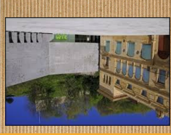
SAN TELMO MUSEOA

San Telmoko museoa eskultura eta artelan asko daude. Euskal Herriko gizartearen inguruko artelan asko ikusi ditzakezu bertan. Museoa izan batna lehen konbentua izan zen. A