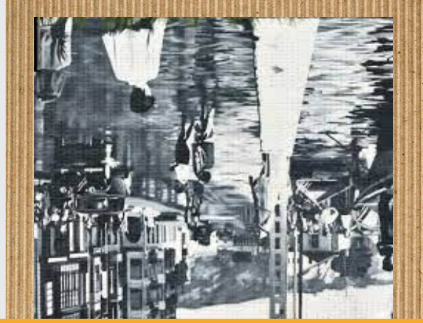
Erandio Ria (El Bolintxi)

Erandio Ria (El Bolintxi) da artelanaren izena eta Malartekak egін zuen.