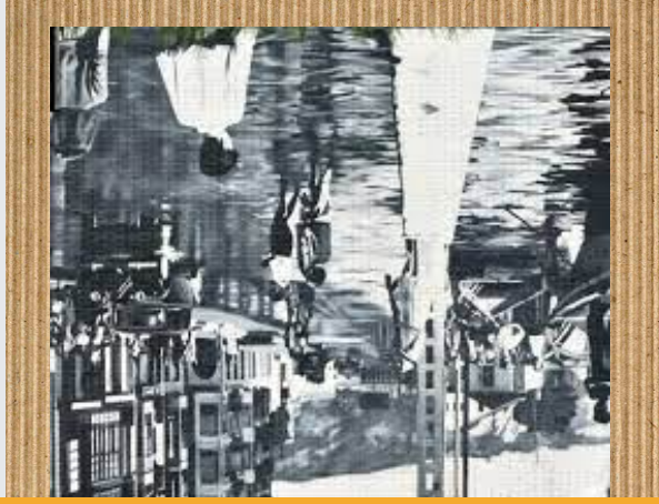
Erandio Ria (El Bolintxi)

Erandio Ria (El Bolintxi) da artelanaren izena eta Malartekak egін zuen.