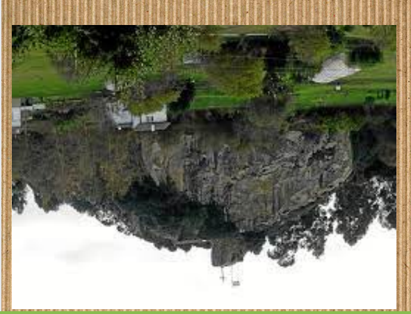
Santa Marinako haitzak

Santa Marinako haitzak urdulizeko goiko aldean A kokatuta daude, ospitaleetik hurbil. A