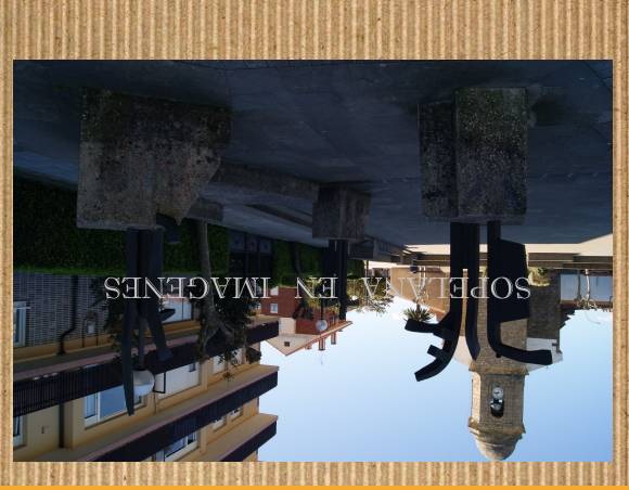
HIRU ESKULTUREN TALDEA

Eskultura Xabier Egoñak egln zuen, 1986.urtean.À Eskulturak airean marraztea irudikatua nahi du. Sopelako ermitaren ondoan kokatuta dago.