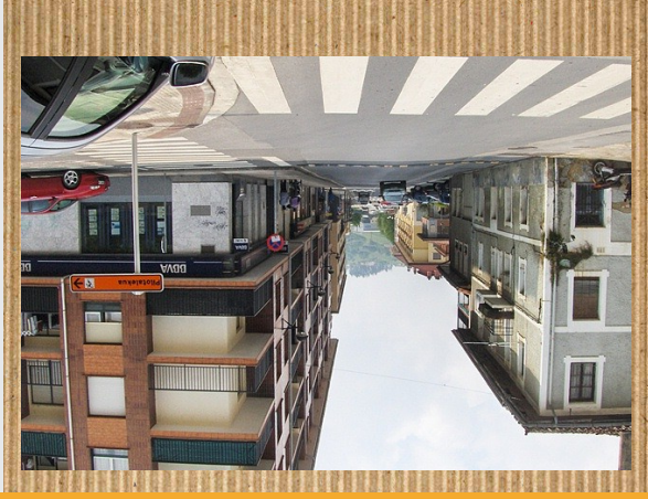
MIREN MAORTUAREN ETXEA