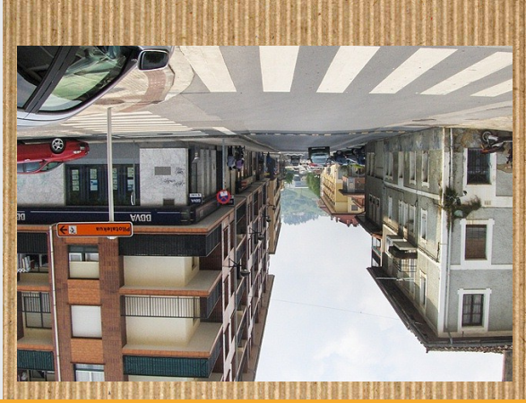
MIREN MAORTUAREN ETXEA