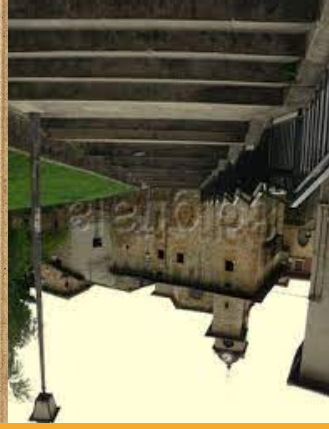
San Andres Elisa

San Andres Eliza Zaldibarko eliza da XIII. urtean erak i zutena, baina XVI. mendean irekitakoa. Kanpandorrea XVIII. mendean erak i zen 1777. urtean hain zuzen Eliza hau XVI. mendean lehenengo erdialdean berrera k i zen, eta zortzi aldeko burualde estuagoa dauka.