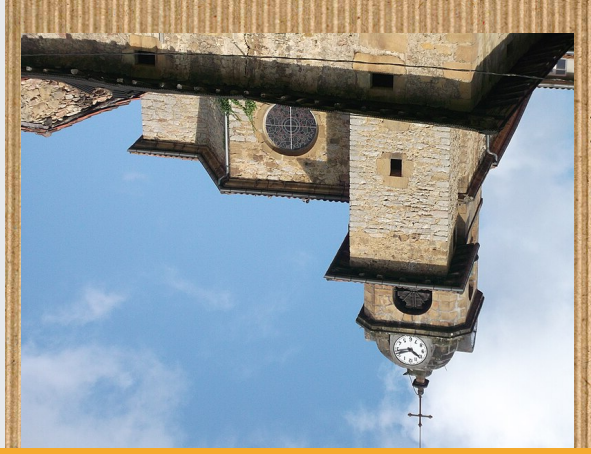
San Andres Eliza

Garzeitz Abarka nafar erregea 10 urtez preso egon zena Zaldibara dorretxean. Bestela, San Andres eliza XIII. mendekoa izan daitezkeela uste dute aditu batzuek.