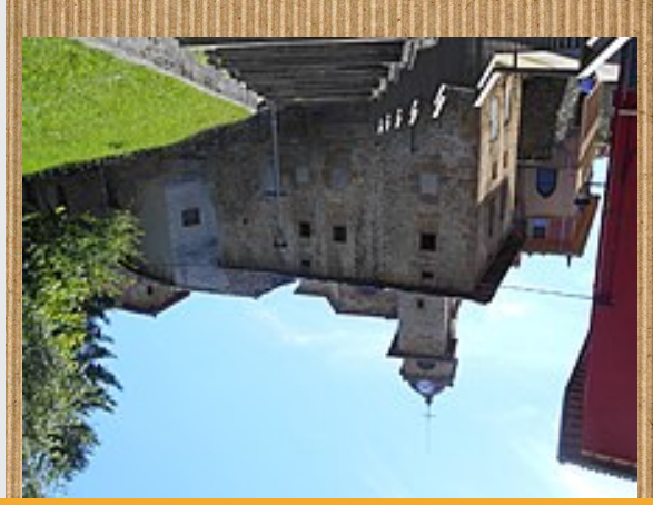
San Andres eliza