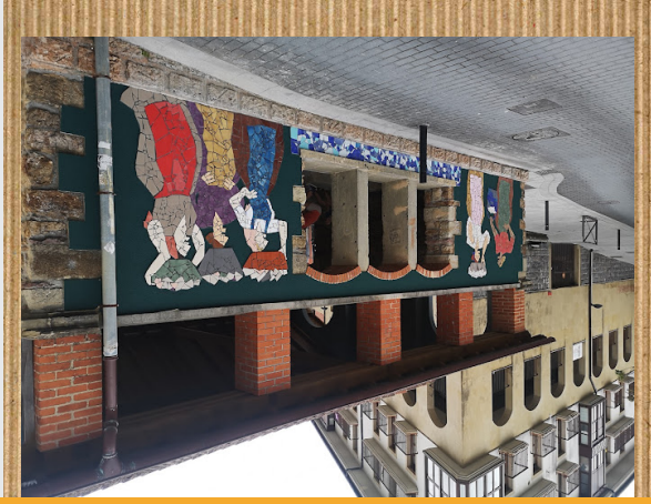
BEHEKO PLAZAKO LABADEROA

Behoko Plazako labaderoa izena du eta Elizalde auzoan dago. Garai batean, asfaltu asfaltu, emakumeak bertara joaten ziren arropa garbitzerak bainu, garbigailuak asmatzearekin, labaderoan arropa garbitzearekin utzi zitzaion. Orain labaderoa umek jolasateko, hitz egiteko... erabiltzen da. Labaderekoko kanpoko pareta Alata gaztelumendi apainduak dira. Arropa garbitzen ari diren emakume irudiak agertzen dira bertan. Kanpotik lehiot handiak ditu. Ladrioz egina dago eta teilatua dauka. Barutik "pistina" bat bezala dago, han arropa garbitzen zen garai batean. Azkenik barrukoa ladrioz egina dago.