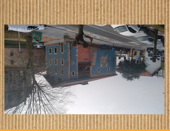
MANUEL LEKUNA LIBURUTEGIA

Manuel Lekuna biblioteka, Oiarzungo udal liburutegia da. Elizalde auzoan dago. Urkabe mendiko aldapa jaitsita aurkitzen gara berarekin, edo bestela Done Eztebe elizari goraka jarraituz ere iritsi daiteke. Liburutegi hau ez da berrita, baina ez dakigu zer garaitakoa den. Asfaltikoa dela esan daiteke zeren eta, armari handiak eta lehiot txikiak ditu, gainera garai batean erabiltzen zitezuten "hondarrezko" harritz egina dago. Nahiz eta gaur egun urdinez margotua topatuko duzun. Manuel Lekuna biblioteka oso ikusgarria da. Barrura ere sartu zaitzeko ordaindu gabe. Guk gomendatzen dugun barrura ere sartzea eta barutik ere ikustea. Ikusteko arazorik ez duzue izango zeren eta, normalean, jende gutxi ibiltzen da. Kanpotik ikusi nahi izanez gero ere ikusgarri dago, barrukoa bezala.