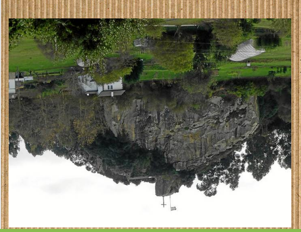
SANTA MARINAKO HAITZAK

Bertan, eskalada egiteko zonaldeak egoteaz aparte, herritarren biriki deritzona topa dezakegu. A