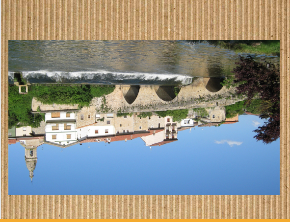
ERDI AROKO ZUBIA

Argantzungo zubia XIII. mendekoa da, erdi arokoa. Gotiko estilokoa da, harrizkoa da eta hiru begi ditu. Garai horretan, harrestuta zegoen herrian satzeko sarrera bezala erabiltzen duten.