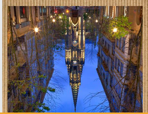
ARTZAI ONA ELIZA

Artzai ona eliza XIXgarren mendearen bukaeran eraiki zen. 75 m neuritzen ditu eta 30 tonelada pixatzen ditu. Bere garaietan 1,5milloi peseta balio zituen.