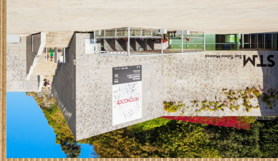
San Telmo Museoa

San Telmo Museoa Urgull mendtaren azpian kokatuta dago. Kuadroak daude eta egile famatuak hauek dira: Jorge Oteiza, Nestor Basterretxea, Eduardo Chillida eta beste asko ere.