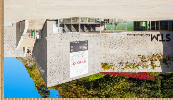
San Telmo Museoa

San Telmo Museoa Urgull mendtaren azpian kokatuta dago. Kuadroak daude eta egile famatuak hauek dira: Jorge Oteiza, Nestor Basterretxea, Eduardo Chillida eta beste asko ere.