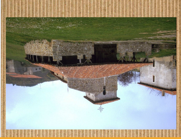
San Pelayo hermita

San Pelayo hermita, Bermeo eta Bakloren artean dago XLA mendean sortu zen.