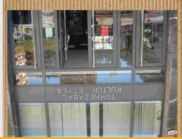
TORREZABAL KULTUR ETXEA

Torrezabal Galdakako kultura etxe bat da, plaza Gorrían dago. Eraikin handi bat da. Liburutegi bat du, pelikulak ikusteko gela, eta erakusketak egiten dira.