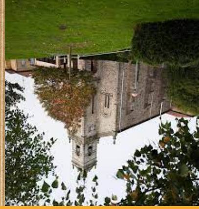
Santa Maria eliza

Santa Maria eliza Galdakao herraren goikaldean dago, Ardantza parkearen goikaldean. Eliza honen lehen eraikuntza XIII. mendean egín zen, urteak pasatu ondoren XVI. mendean, berriztu egín zuten. Aurore batzuek uste dute, aurretik egon zen eraikin baten gainean eraiki zutela eliza.