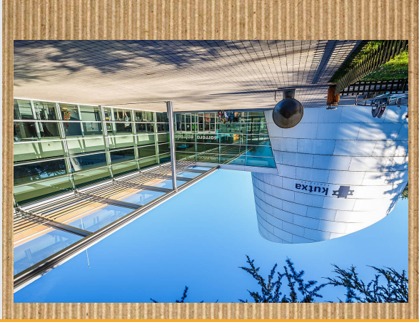
EUREKA ZIENTZIA MUSEOA

Museoa zientzia eta teknologia munduari buruzko museoa da, eta kultura eta hezkuntza balabide bat da. Eureka Zientzia Museoa, museo interaktiboa edo elkarreagilea da; Informazioa eta irakasgarria aurketzen da bertan objektuak manipulatu eta esperientzak eginez.