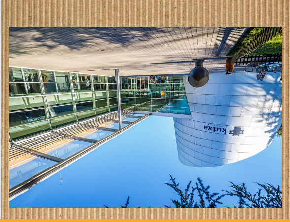
EUREKA ZIENTZIA MUSEOA

Museoa zientzia eta teknologia munduari buruzko museoa da, eta kultura eta hezkuntza balabide bat da. Eureka Zientzia Museoa, museo interaktiboa edo elkarreagilea da; Informazioa eta irakasgarria aurketzen da bertan objektuak manipulatu eta esperimenduak eginez.