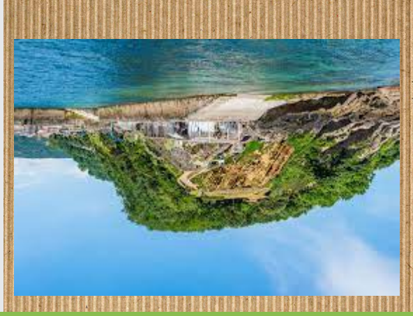
Santa Clara irla

S. Clara irla bat da. Kontxako badiatzen erdian dago, handia da. A irlara itsasontziz joan behar duzu eta han egun pasa egin dezakezu.