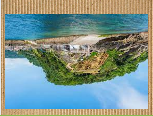
Santa Clara irla

S. Clara irla bat da. Kontxako badiaren erdian dago, handia da. A irlara itsasontziz joan behar duzu eta han egun pasa egin dezakezu.