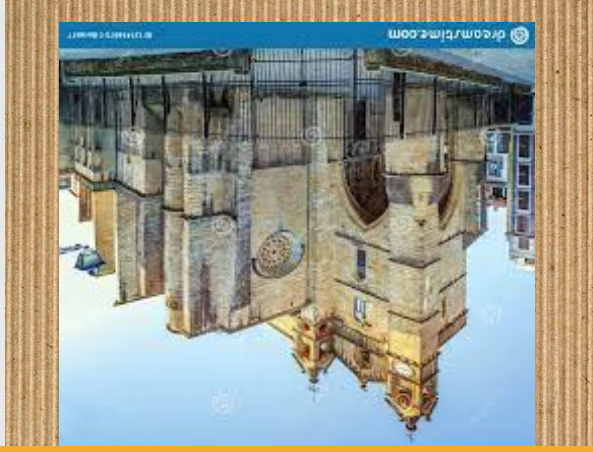
San Vicente eliza

Alde Zaharran kokatua dago. Altua eta zaharra da. Harritz egina dago. XVI. mendean sortu zen.