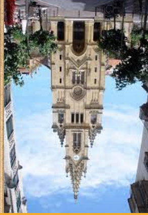
SAN IGNAZIO ELIZA