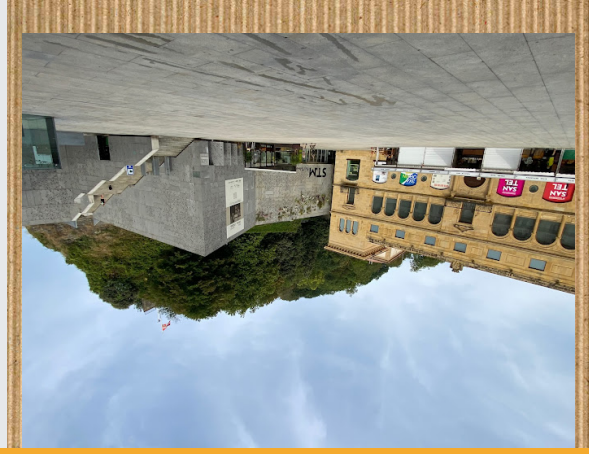
SAN TELMO MUSEOA