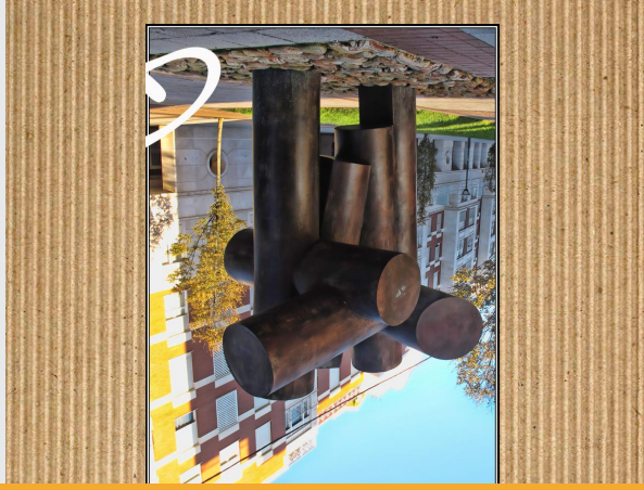
Udondoko eskultura (ezizena)