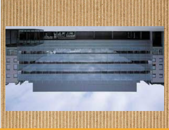
Leioako Kultur Etxea