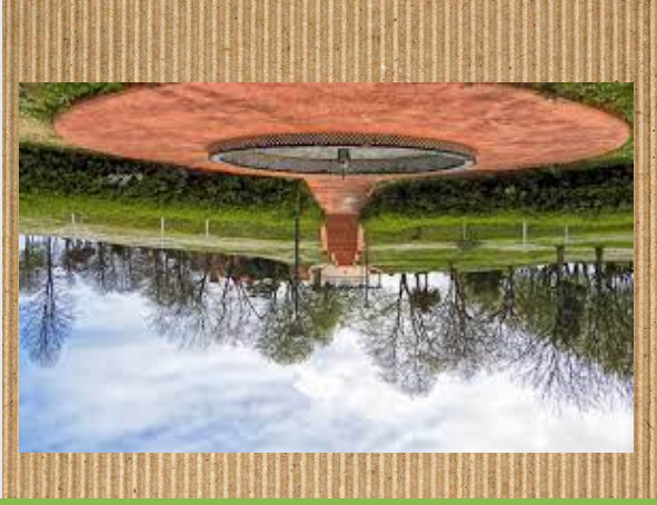
Artatza parke naturala

Artatza, Leioan dagoen Parke natural zabal bat da non, bizitoki asko dago toki bat da.