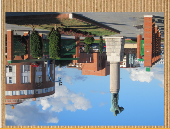
Rober kireren eskultura