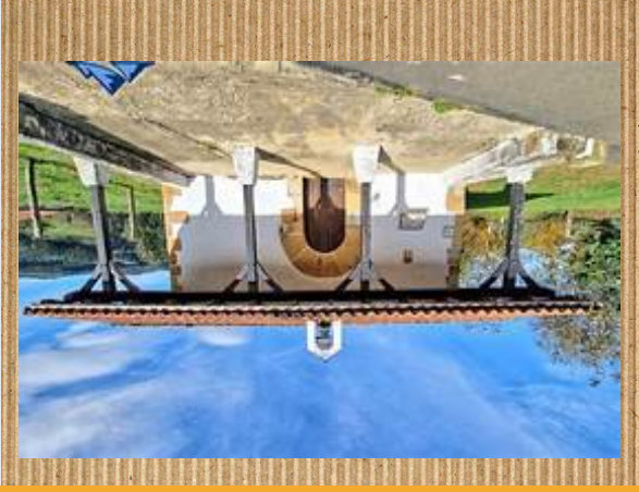
Ermita de Pedro y Cristobal

Mendata urbil dago erdialdetik eta bi edo hiru etxe daude inguruan. Ermita de San Pedro y San Cristobal hiru muñeko jainkoan jata baruan eta 8 edo 10 bankuak daude baruan. A