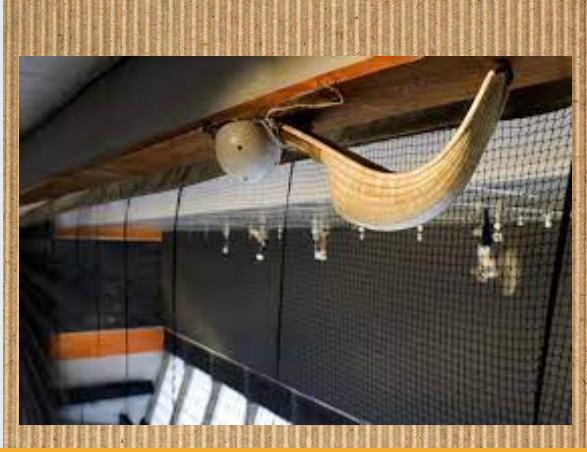
Jai Alai frontoia