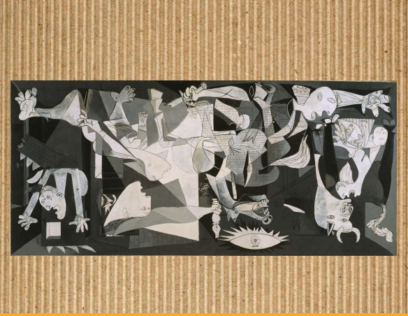
" Guernica "