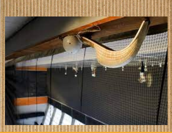
Jai Alai frontoia