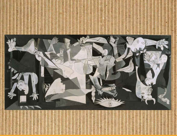
" Guernica "

Gernika, Pablo Picassoren margolan famatu bat da, 1937ko matzetik ekainera bitartean margotua. 1937ko apirilaren 26an Espainiako Gerra Zibilean izandako Gernikako bonbardaketa irudikatzen du. Margolana 3,5 metro garai eta 7,8 metro zabal den oihal baten gainean olio pinturaz margotuta dago.Å