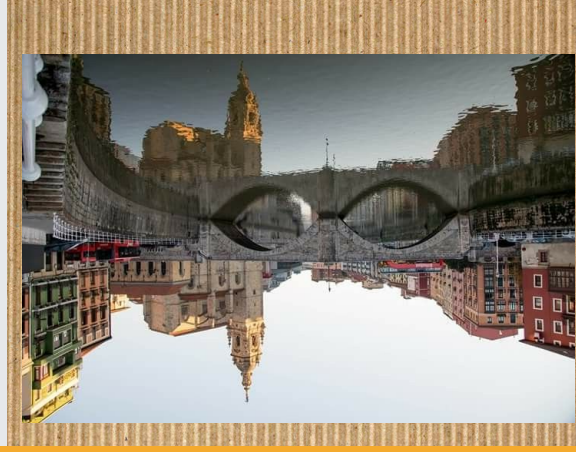
SAN ANTON ZUBIA