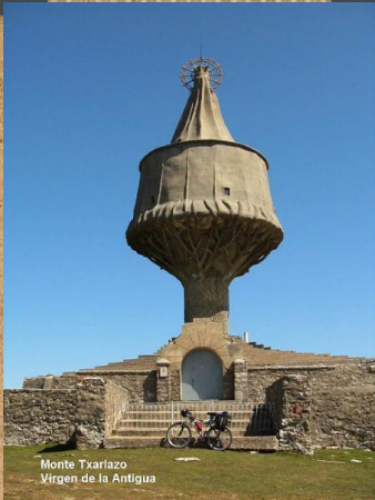
Monte Txarrazo Virgen de la Antigua

Hemen Orduñan gauza asko daude egiteko eta ikusteko.Â Esporatzeko prest zaudete?