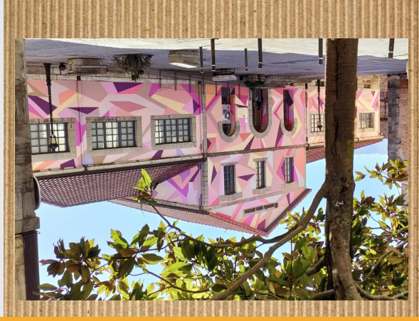
Urduñako Hiria Museoa