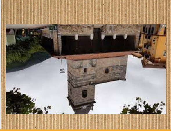
Eliza (san miguel)