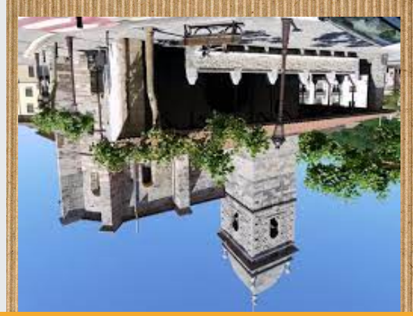
San migal eliza