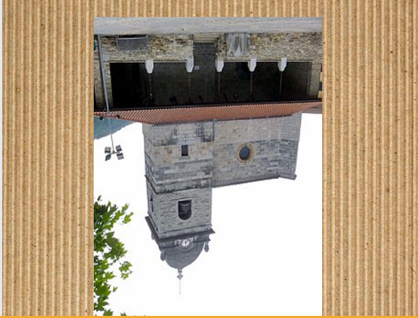
SAN MIGEL ELIZA

San Migel eliza Gipuzkoako Iruña udalerrian dagoen eliza gotikoa bat da, Tolosaldea eskualdean. Done Mikela gotzingeruari sagaratu dago.