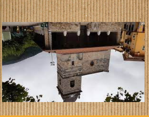
San miguel Eliza