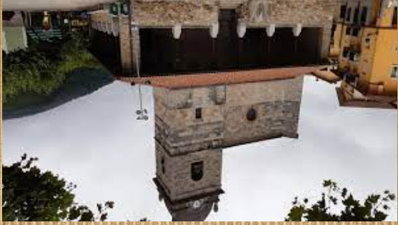
San miguel Eliza