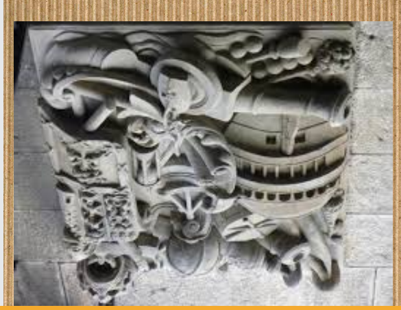
El palacio Arrietakua

Artelan hau juregi Arrietakuan dago eta ez dauka izentik. Lehenego ikusten duan gauza, kanoi bat da, A eta bigarrena, ezkerrean eta erdialdean dagoen itsasontzia. A Eta zehatzago ikusi ditudan gauzak, A hiru dira, pertsona bat eta A ingura A eta sare batzuk. Pertsona hau eskuturako alde gotaldean dago. Eta aingurak eta sareak eskuturako alde guztietatik daude.