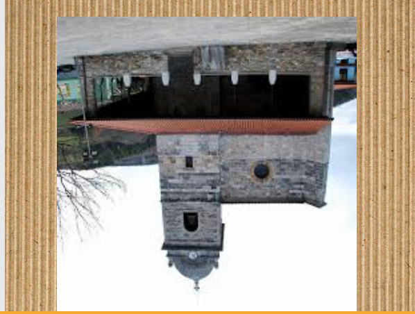
San Miguel Eliza

San Miguel eliza Gipuzkoako Irura udalerrian dagoen eliza gotikoa bat da, Tolosaldean . Done Mikel A gotangeruari sagartua dago.